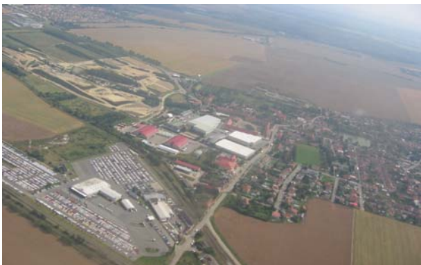
Tak tady jsme někde na západ od Prahy těsně po startu.